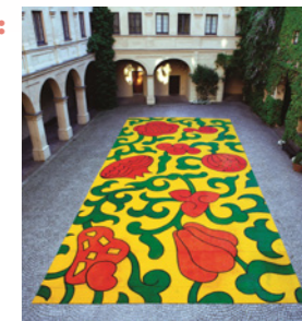
Thomas Weil, BLOOM IN, 2008

Die Kunst von Thomas Weil Das Museum präsentiert vom 24. Januar bis 26. April 2026 Werke des Friedberger Ornamentkünstlers Thomas Weil. Weil (geb. 1944) arbeitet seit Jahrzehnten im Bereich des Ornaments in Kunst, Design und Architektur. Schon in den 1970er Jahren verantwortete er die farbliche und formgebende Gestaltung der Außenanlage des Olympischen Dorfs in München sowie die Innenarchitektur des Ismaili Centre in London. Bis heute entwickelt er das Ornament weiter. Für diese Ausstellung werden seine Werke erstmals in einer spektakulären Medieninstallation von LAB BINÆR aus Augsburg animiert.