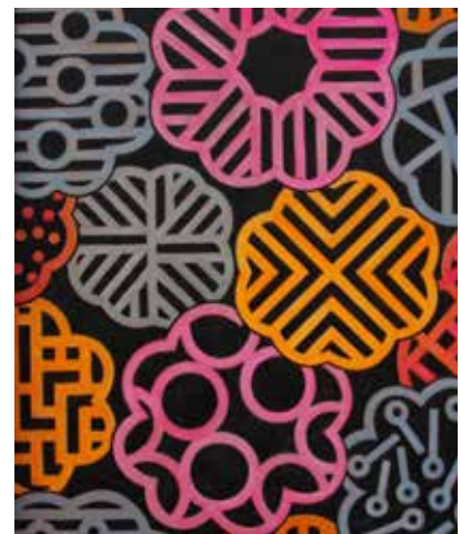
Thomas Weil, BF 219, 2021, Öl auf Leinwand

Die Ausstellung gibt einen Überblick über Weils vielfältiges Schaffen. In einer eindrucksvollen Installation des Augsburger Labors für Medienkunst, LAB BINÆR, werden seine Kunstwerke erstmals in animierter Form projiziert und scheinbar endlos vervielfältigt gezeigt. In der virtuell bewegten Optik erreicht das Werk von Thomas Weil eine neue Dimension.