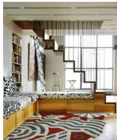
Thomas Weil, Interieur Privathaus Friedberg, 1992

Mi, 04.03., 18.30 Uhr Ornament für Raum, Kunst und Design Vortrag von Thomas Weil Teilnahme 3 €, Anmeldung unter 0821/6002-684